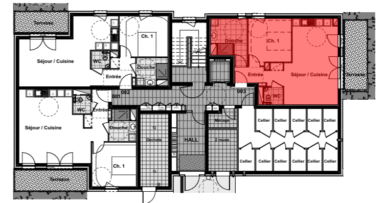
Rez de Chaussée

KLEIN + HASSLER Architectes d.p.l.g. 3 rue du pré vaillieux 57 050 Longeville-les-Metz tel : 03 87 68 02 80 - e mail : accueil@klein-archi.com