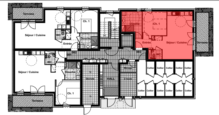
Rez de Chaussée